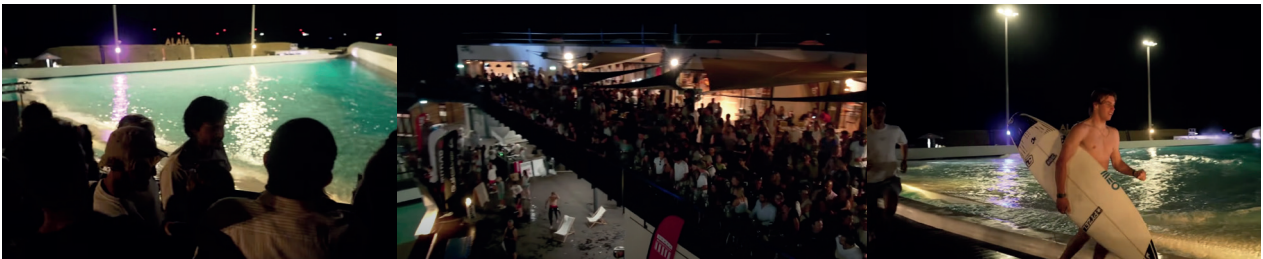
Forte affluence dans le surfpark suisse.

Sources : https://tinyurl.com/yskcxupf et https://tinyurl.com/muaa4ty6